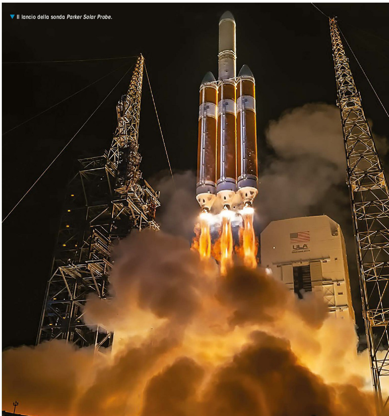
▼ Il lancio della sonda Parker Solar Probe .

Nel 2005, su richiesta della NASA, gli ingegneri del Johns Hopkins Applied Physics Laboratory a Laurel, nel Maryland, hanno progettato Solar Probe , una missione che sarebbe arrivata a meno di tre milioni di chilometri dal Sole. Si trattava di una missione costosa, più di un miliardo di dollari, e avrebbe richiesto un generatore nucleare, che la NASA non voleva usare perché il plutonio disponibile è limitato e la NASA preferisce riservarlo per le missioni verso l'esterno del Sistema Solare, oppure su Marte. Inoltre, a causa dell'intensità del calore, la missione si sarebbe limitata a due soli fly-by .